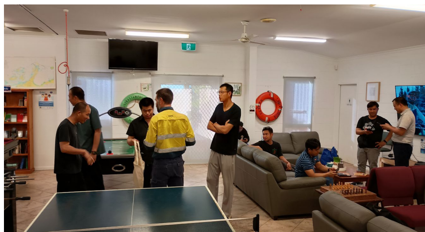
Des marins profitent du centre Mission to Seafarers à Port Walcott.

Un chargement de bauxite provenant de notre mine d’Amrun, dans le Queensland (Australie), prêt pour le départ.