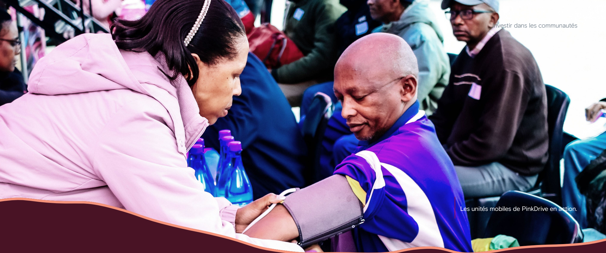
Les unités mobiles de PinkDrive en action.