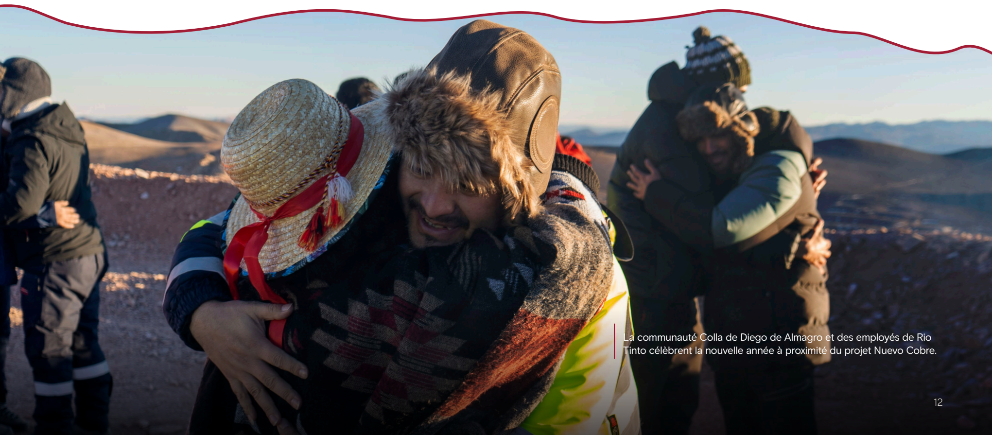
La communauté Colla de Diego de Almagro et des employés de Rio Tinto célèbrent la nouvelle année à proximité du projet Nuevo Cobre.