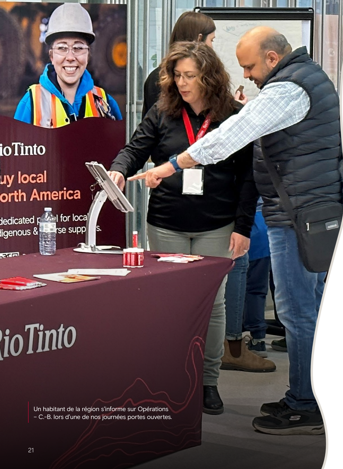
Un habitant de la région s'informe sur Opérations - C.-B. lors d'une de nos journées portes ouvertes.