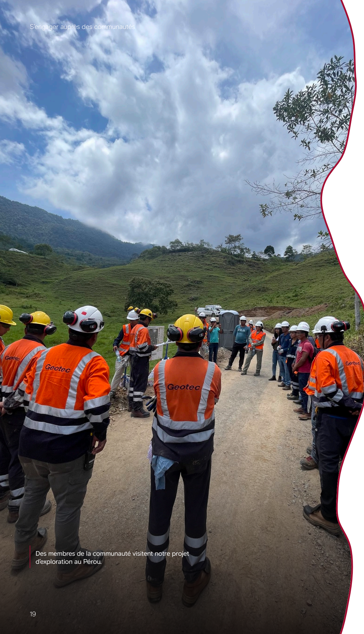
Des membres de la communauté visitent notre projet d'exploration au Pérou.